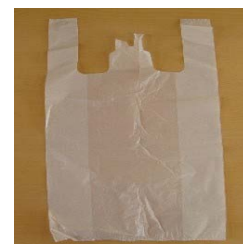
ナイロン袋 汚れた衣服を 持ち帰ります