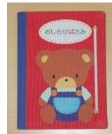
お知らせバサミ (持ち帰った翌日)