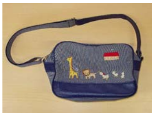
通園カバン (指定はありません)