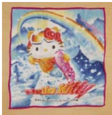
手拭ハンカチ (ズボンポケットに まつ・ふじ組)