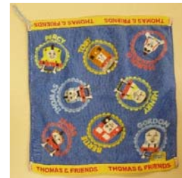
手拭タオル (ひも付き／たけ組)