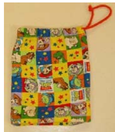
箸・箸箱 ごはん入れ袋